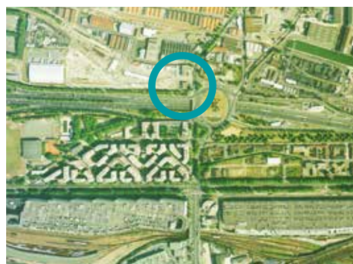
1989 : la Gare des Mines dans sa deuxième version (actuelle), suite à la construction du périphérique parisien

L'activité de la Gare des Mines s'arrête en 1983, pour des raisons économiques. Le site de la Gare des Mines, propriété de la SNCF, est alors réaménagé, notamment à travers la création d'un bâtiment logistique à l'ouest et de nouveaux bâtiments au centre, en lieu et place de l'ancien chemin de fer. Bien que la gare soit désormais déconnectée du réseau ferroviaire, les rails sont encore visibles à plusieurs emplacements. Pendant quelques années, la gare des mines accueille une discothèque africaine, le Balafon, dont les traces subsistent encore au sein du bâtiment. Aujourd'hui, le site de la Gare des Mines concentre essentiellement des activités industrielles, de stockage ou commerciales.