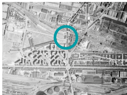
1954 : la Gare des Mines dans sa première version