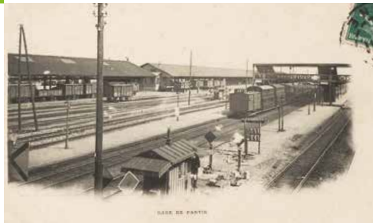
Wagons de marchandises devant le quai couvert

Sur le quai couvert, desservi d'un côté par des voies ferrées et de l'autre par une cour, s'opère le chargement et le déchargement des marchandises du wagon et du quai dans les véhicules. Par ailleurs, la gare a accueilli différents édifices :