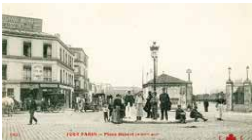
La place Hébert - 1900

Le site d'Hébert est une zone ferroviaire de 5,2 hectares, située dans le 18 ème arrondissement de Paris entre la Porte de la Chapelle et la Porte d'Aubervilliers, le long des voies de chemin de fer. Créé aux environs de 1896, le lieu est dévolu à l'accueil de wagons de marchandises, acheminés par à ses nombreuses voies le reliant au réseau ferroviaire de l'est de la capitale. D'une superficie alors plus importante, le site d'Hébert s'insère au sein d'un vaste complexe industriel et ferroviaire occupant le nord-est parisien.