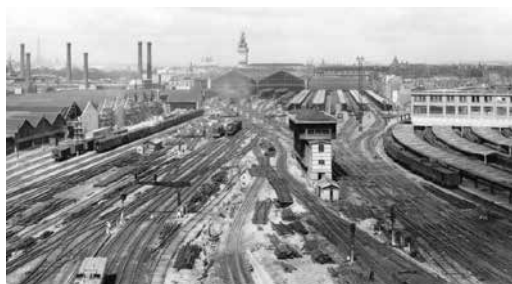
Les emprises ferroviaires de la Gare de Lyon à la fin des années 1940

Mais plus de 35 ans après, la création du TGV postal relance l'activité ferroviaire. Un centre de tri postal voit le jour ainsi qu'une Halle des Messageries , bâtiment accueillant aujourd'hui Ground Control. Cet ensemble architectural construit à partir de 1925 est encore visible : structures en béton et remplissage de briques, toitures voûtées en béton ou terrasse, verrières métalliques en élévation, sheds et lanterneaux vitrés. La Halle des Messageries de Charolais est l'une des dernières grandes halles ferroviaires de cette époque dans Paris intra-muros.