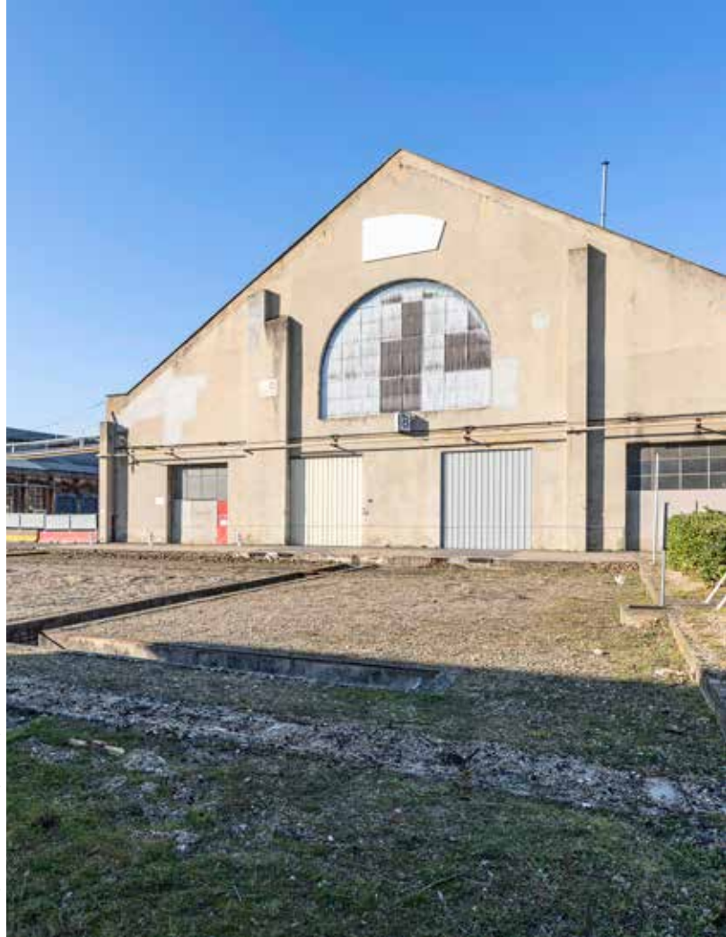
© Thierry Fournier - Métropole de Lyon

En collaboration étroite avec les acteurs culturels et la commune de la Mulatière, avec l'appui et le soutien de la SNCF, les Grandes Locos ont fait l'objet d'études de faisabilité qui permettent de proposer, en préfigurant les objectifs de programmation du projet urbain, l'implantation de ces grands événements dès leurs éditions 2024.