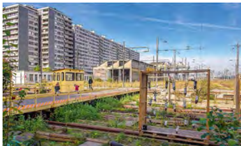
Grand Train