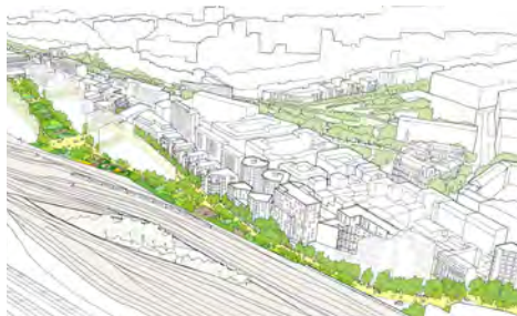
Intentions urbaines Gare de Lyon © Roger Stirk Harbour & Partners