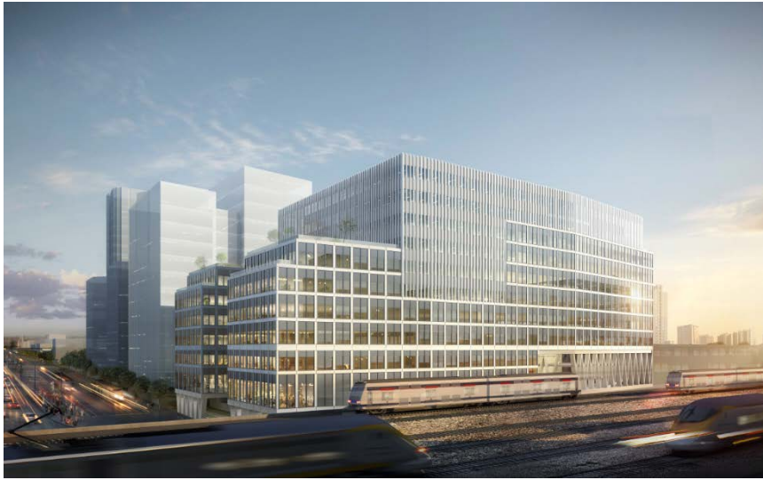
Bureaux. Lot A. © Arte Charpentier