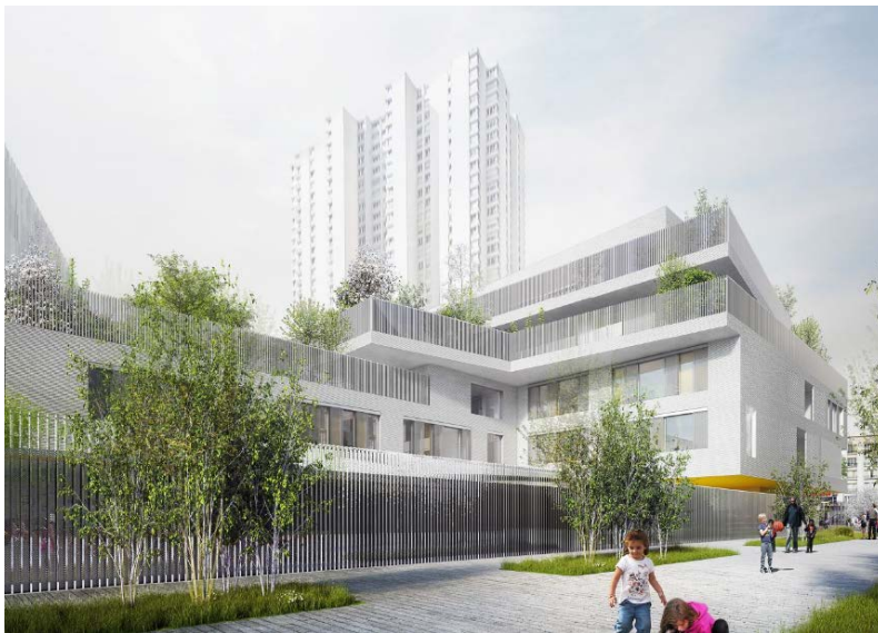
Lot D (école). © TOA Architectes associés