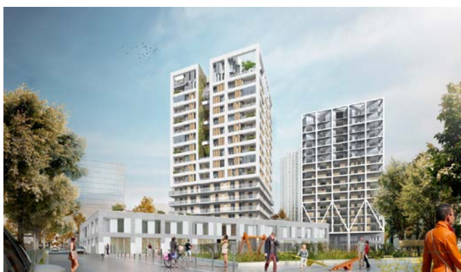
Logements en accession à la propriété © Brenac & Gonzalez - MOA Architecture