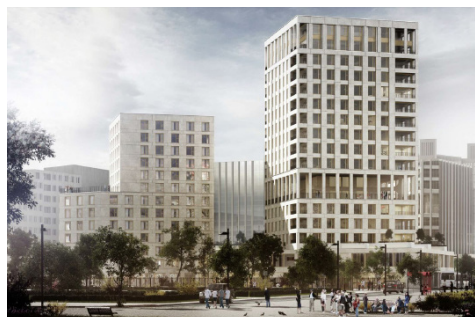
Lot F visuel façade ouest

© Atelier Martel - Charles Pictet Architecte